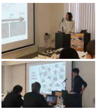
学生の皆さんのプレゼンの様子