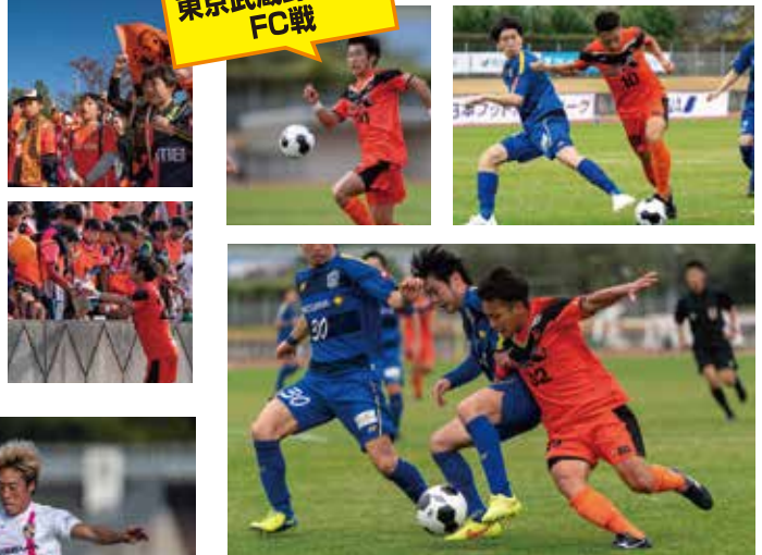
東京武蔵野シティ FC戦