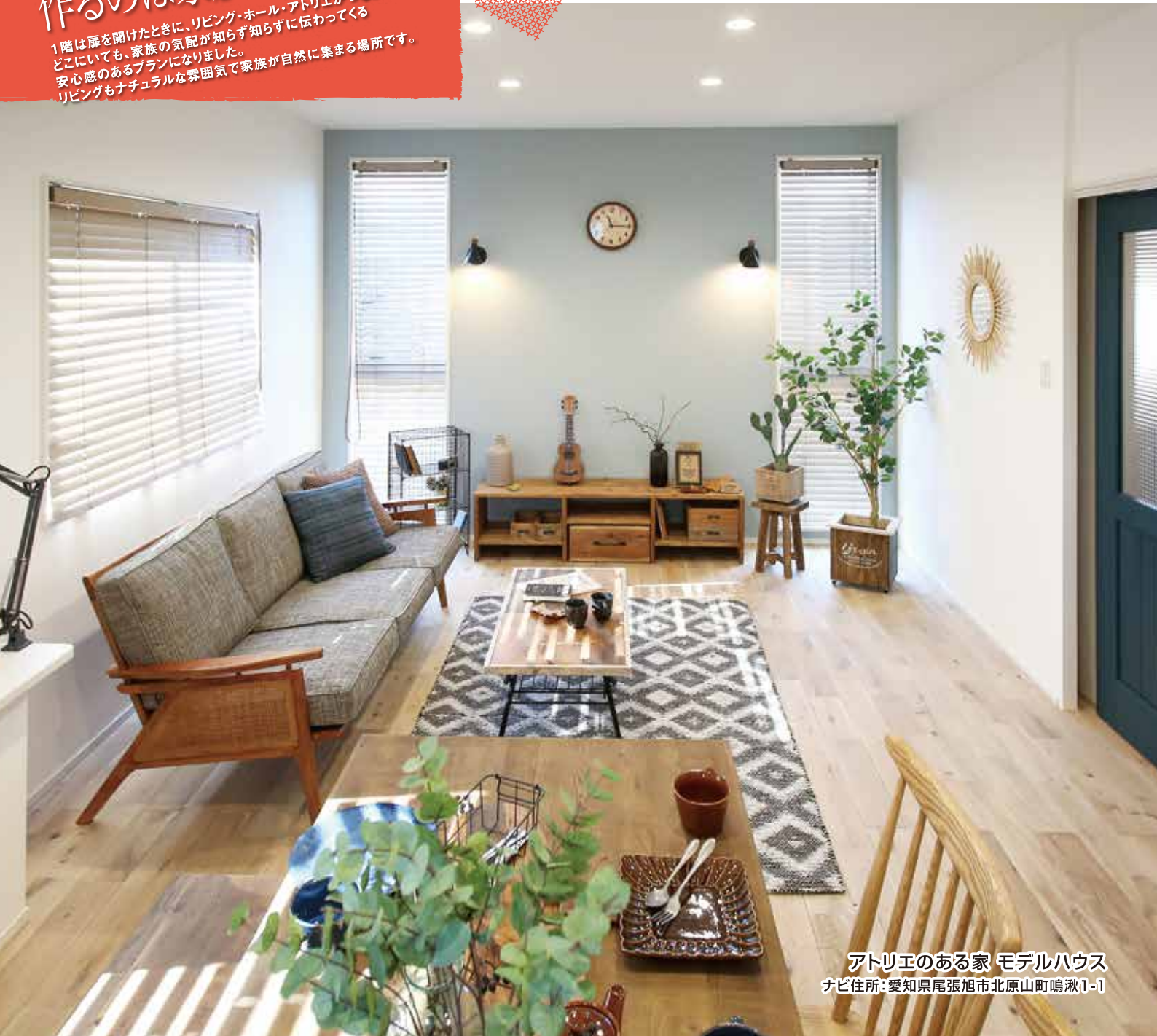
アトリエのある家 モデルハウス ナビ住所: 愛知県尾張旭市北原山町鳴瀬1-1

1階は扉を開けたときに、リビング・ホール・アトリエがつながり どこにいても、家族の気配が知らず知らずに伝わってくる 安心感のあるプランになりました。 リビングもナチュラルな雰囲気家族が自然に集まる場所です。