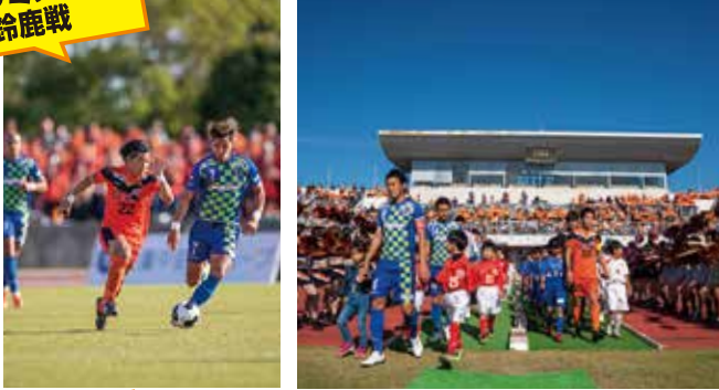
アンリミテッド 鈴鹿戦